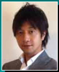
株式会社SAATS 代表取締役 CEO