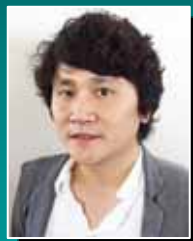
株式会社SAATS Amazon輸出講師