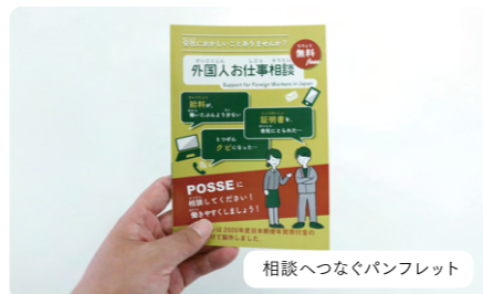
相談へつなぐパンフレット