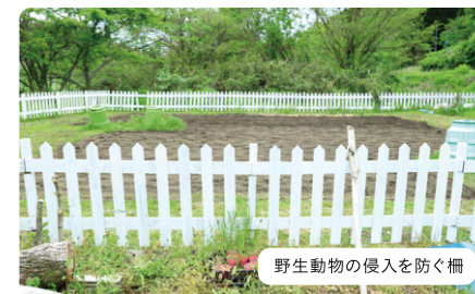
野生動物の侵入を防ぐ柵

既存の作業所は宮城県石巻市で使われていた仮設住宅を無償譲渡されたもの。手狭になってきたことで新たな作業場所としてログハウスを建設。年賀寄付金助成金を活用して水回りや電気工事などの内装工事と、野生動物に荒らされて困っていた畑の侵入防止柵や倉庫を設置。ログハウスの環境を整えることで、支援を行える対象が広がった。