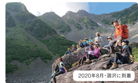
2020年8月・瀬沢に到着

長野県は3,000m級の山々に囲まれた日本を代表する山岳県。全国から登山者が訪れる有名なスポットである。しかし登山経験者でも子どもと一緒に登山することは難しい。そこで、年賀寄付金助成金を活用し、小学生とその保護者向けに子どもたちと一緒に安全登山を身につけられるファミリー登山教室を開催し、登山者の育成に取り組んだ。