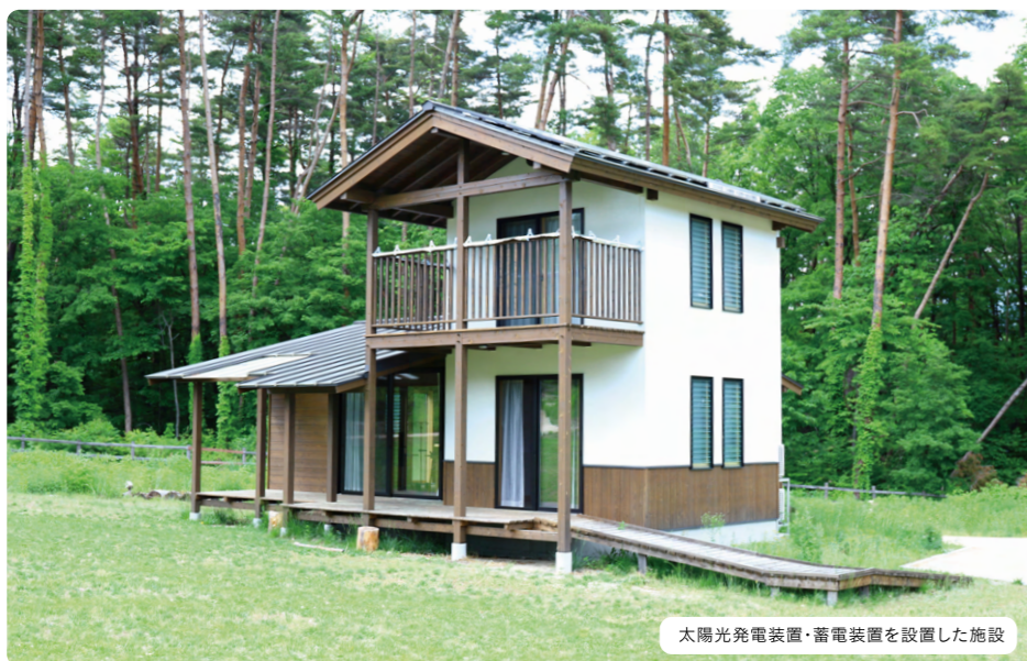
太陽光発電装置・蓄電装置を設置した施設