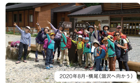
2020年8月・横尾(瀬沢へ向かう)