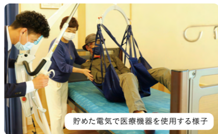
貯めた電気で医療機器を使用する様子

重度の心身障がい者と家族のための宿泊施設「あおぞら共和国」の5号棟を新設し、年賀寄付金助成金を活用して太陽光発電装置と蓄電装置を設置した。人工呼吸器や吸引器などを使用する方は、停電が命にかかわることもある。電源を自給できるようになったことで、防災対策と環境対策ができ、重度の心身障がい者が利用できる施設になった。