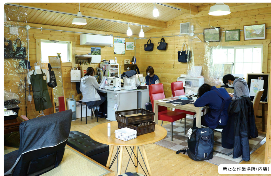
新たな作業場所(内装)