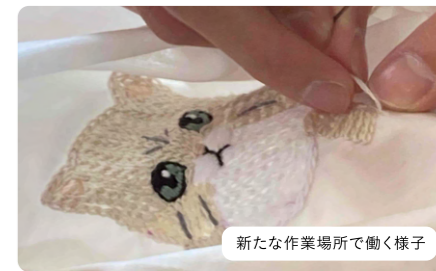
新たな作業場所で働く様子