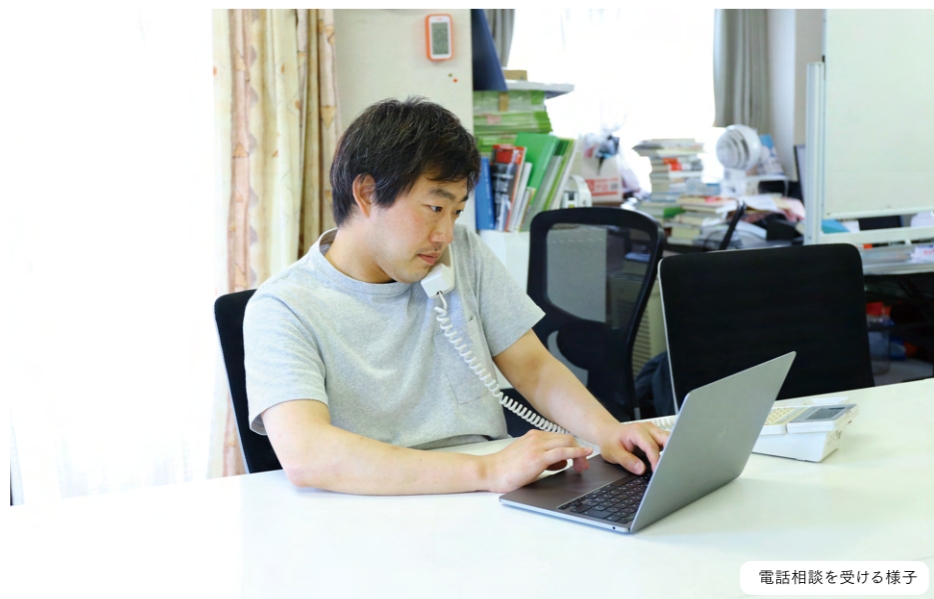
電話相談を受ける様子