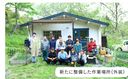
新たに整備した作業場所(外装)