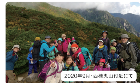
2020年9月・西穂丸山付近にて