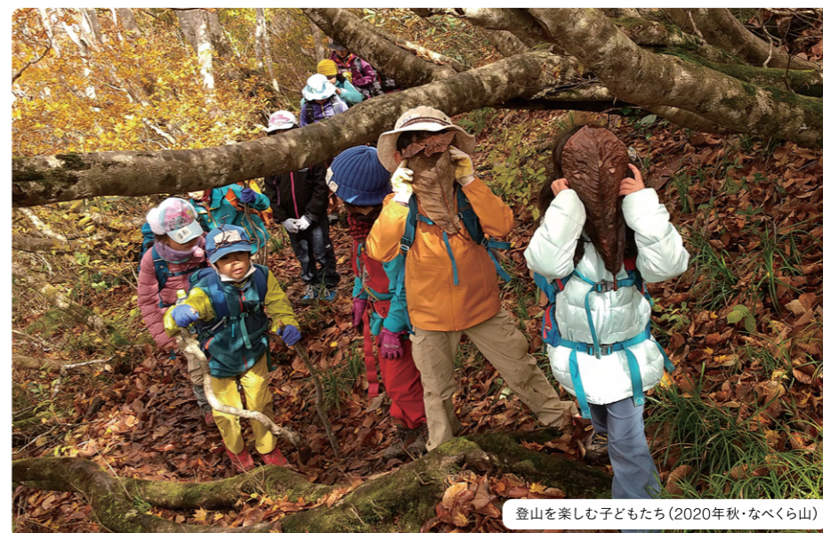
登山を楽しむ子どもたち(2020年秋・なべくら山)