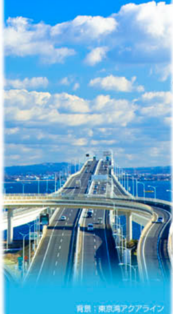
背景：東京湾アクアライン