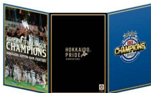
〈特製プレミアムホルダー：表面〉