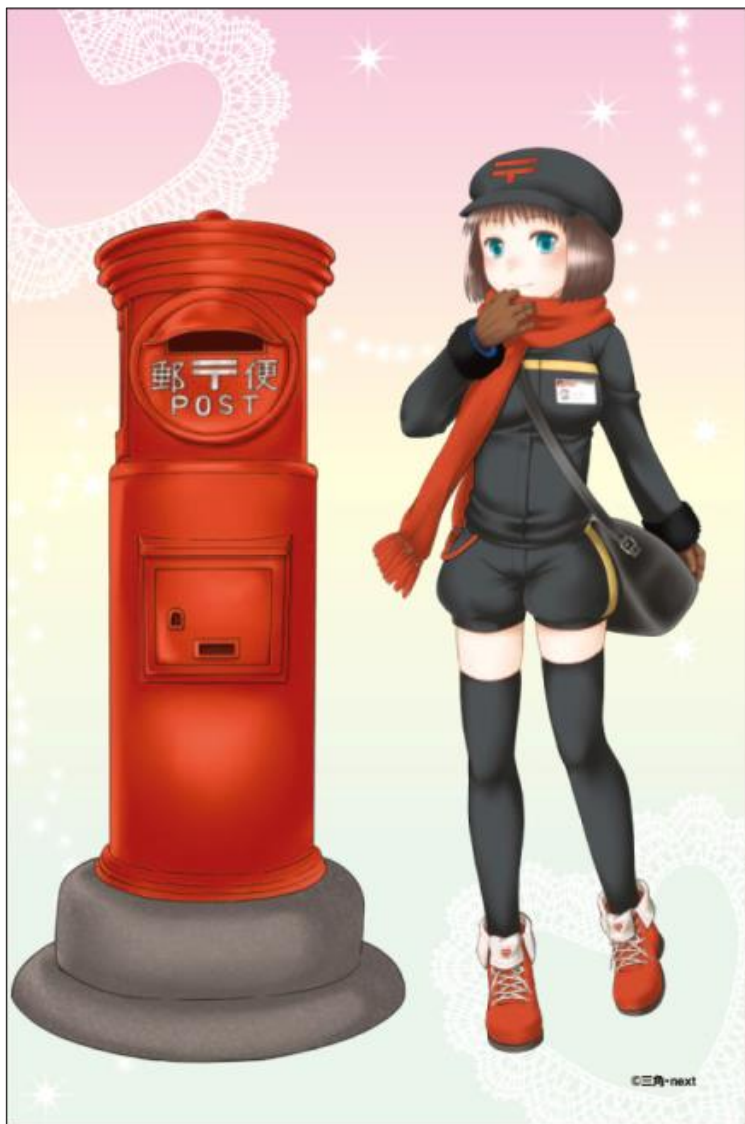
【ポストカード（デザイン面）】