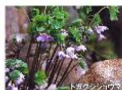
トガクシショウマ