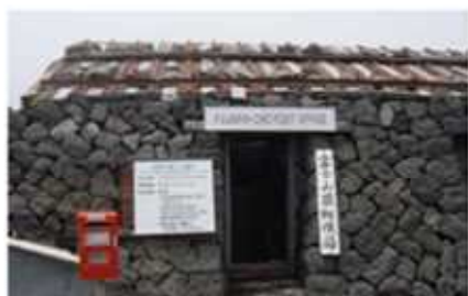
静岡県富士宮市粟倉地先 浅間大社奥宮社務所(富士宮口頂上)

開設期間は、2013(平成 25)年 10 月 17 日(木)から 10 月 30 日(水)[14 日間]