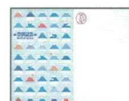
専用クリアファイル (表) (裏)