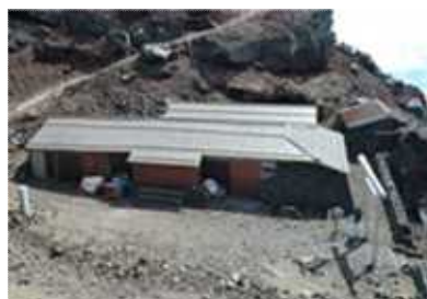
静岡県駿東郡小山町須走 銀明館(御殿場口頂上)

浅間大社 奥宮社務所の 改修工事に伴い 2013 (平成 25)年 7 月 13 日 移転