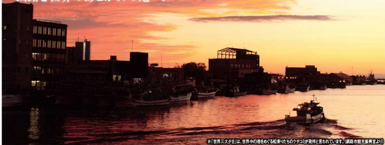
※「世界三大夕日」は、世界中の港をめぐる船乗りたちのクチコミが発祥と言われています。(釧路市観光振興室より)