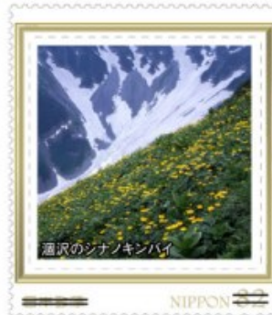
瀧沢のシナノキンバイ