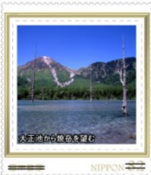
大正池から煖岳を望む