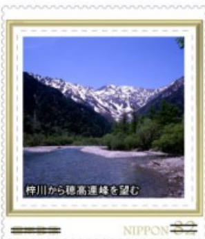
梓川から穂高連峰を望む