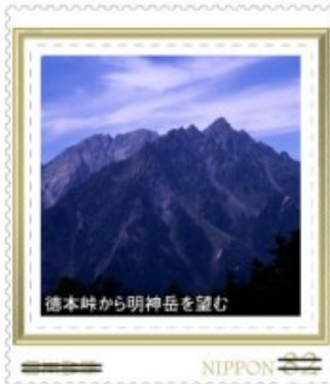
徳本峠から明神岳を望む