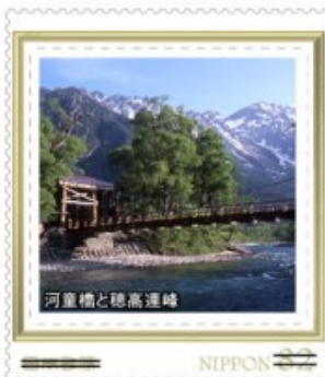
河童橋と穂高連峰