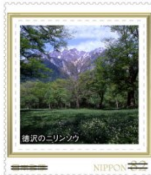
徳沢のニリンソウ