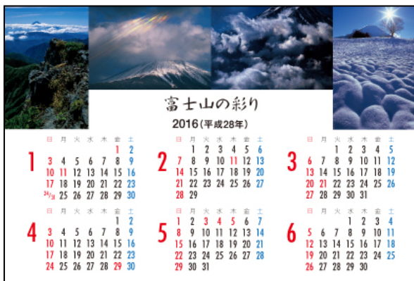
カレンダー（表面）（1月～6月）