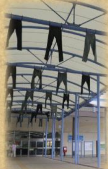
児島駅を飾るジーンズ