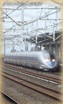
新倉敷駅と山陽新幹線 (昭和50年開通)