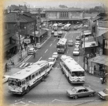
旧倉敷駅南側(昭和40年代)