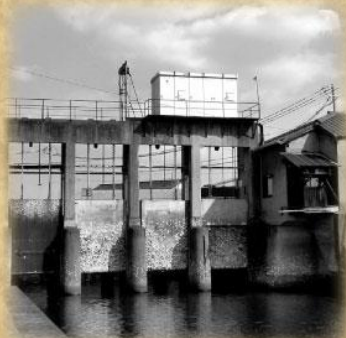
玉島の旧水門(昭和23年～平成24年)