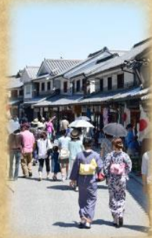
電線類地中化後の本町通り