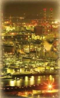
水島コンビナートの夜景