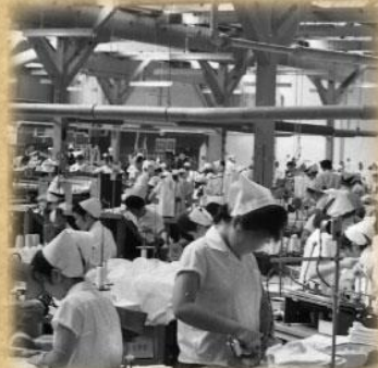
児島繊維産業の工場(昭和30年代)